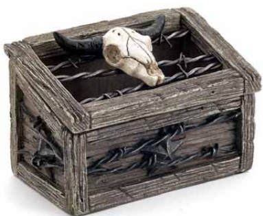
【スカル&ワイヤーのトリネットボックス】 ウエスタンデザインのワイルドな小物入れ。朽ちた木の表情などをレジンでリアルに再現。サイズ(約)：H 8×W12.5×D7.5センチ/1800円 (Candy Tower ☎06-6698-6969 www.candytower.com)