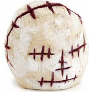
【骨飾り/gettyカードスタンド】 スカルとしては半人前、若干“肉”が残ってる感じのgetty君は、角材から生まれたちょっと軽めのカードスタンド。ハンドメイド/735円 (四月館十黒 ☎086-425-9121 www.darkapril.net)