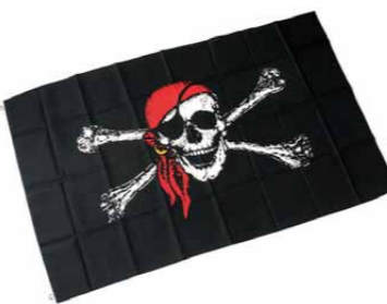
【海賊マークのジャンボタペストリー】 海賊と言えばこの旗印! わかりやすい海賊マークを大きくプリントしたタペストリー。サイズ(約)：H90×W155センチ/1800円 (Candy Tower ☎06-6698-6969 www.candytower.com)