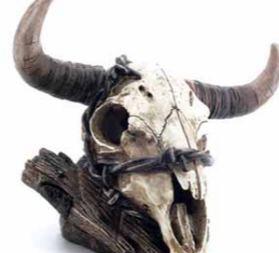
【バッファローズカルのナイトライト】 バッファローホーンをリアルに再現したレジン製のナイトライト。有刺鉄線が巻きついている美しいデザイン。サイズ：H20×W24×D16センチ/4900円 (Candy Tower ☎06-6698-6969 www.candytower.com)