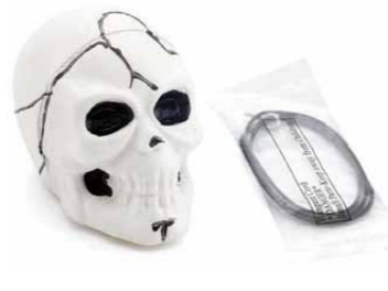
【スカルホーンのアンテナトッパー】ありそうでなかったスカル型のアンテナトッパー。ワルの象徴“スカル”的ムードを演出したい時には最高に効果的/380円 (Candy Tower ☎06-6698-6969 www.candytower.com)