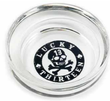
【LUCKEY13/Death Skull Ash Tray】 ガラス製の灰皿。アクセサリー入れとしても使えるので、スモーカーにもونسモーカーにもオススメ。ギフトにも最適/1575円 (LUCKY13日本代理店エバークロー貿易 ☎04-2945-9175 www.rakuten.co.jp/lucky13)