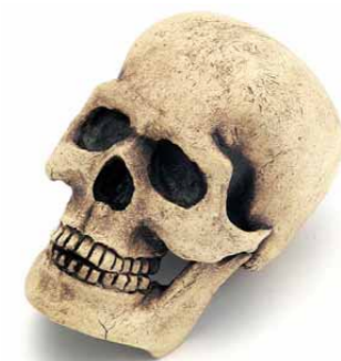
【大友窯SKULL/髷オブジェ】 陶土ならではの手触り&色合いと、本物の髷が持つ質感を融合。土遊び焼き上げまでこだわり抜いた、真正正銘世界でひとつだけの逸品/6000円 (大友窯工房 ☎096-380-6449 http://otomogama.net)