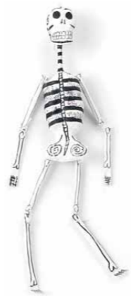
【スカルジュエリーハンガー】(二) 個個異なるリングをそのまま照らしてキラキラと輝かせる。SHOP 風アレンジインテリアを演出。by 1. new territory (SKULL DADDY (ネット販売のみ) http://skulldaddy.jp)