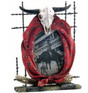
【ロングホーンカルのピクチャーフレーム】 超ワイルドなフォトフレーム。本体はレジン製で見事なほどリアルに仕上がっている。サイズ(約)：H27×W21×D7センチ/3200円 (Candy Tower ☎06-6698-6969 www.candytower.com)