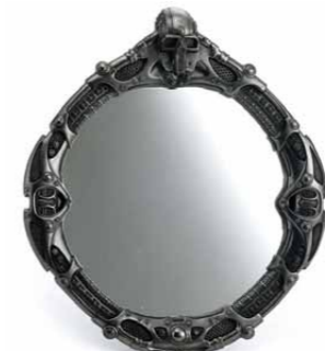
【メタリックスカルフレームミラー】 2009年AWの新作。面厚な質感はモントーンの部屋によく合う。サイズ：H29×W25.5×D3センチ 素材：ポリレジン/3990円 (SKULL DADDY (ネット販売のみ) http://skulldaddy.jp)