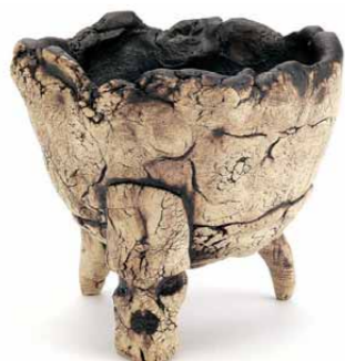
【大友窯SKULL/髷小物入れ】 脚の部分がさりげなく髷のモチーフになっている。灰皿や花器、カップなど用途はアイデア次第。ひとつひとつ手作業で成型した一点物。高さ8センチ。陶器製/5000円 (大友窯工房 ☎096-380-6449 http://otomogama.net)