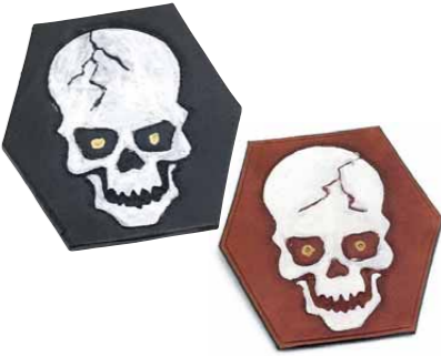
【コースター】 革にスカルをカービングし、その上に染色して作られたコースター。ちょっと変わったインテリアにも。枚数やカラーはオーダー可能。10センチ×10センチ/各1575円 (DIA BOLIC ☎024-935-3564 www.diabolic.jp)