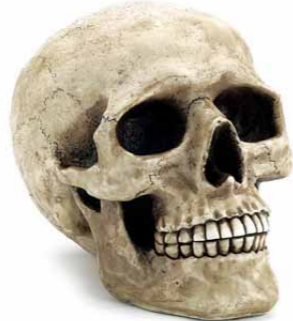
【スカルバンク (L)】スカル雑貨ブランド「SKULL DADDY」スター当初からの定番品。帽子やヘルメットを被せてもよし、貯金箱として利用してもOK。素材：ポリレジン/3150円 (SKULL DADDY (ネット販売のみ) http://skulldaddy.jp)