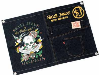
【Skull Jeans by an alchemist/デニム製バナー】 フラッシュ部分はラバープリント、ロゴはチェーンステッチ、ポケットには隠しレベットなど、ジーンズのディテールをそのまま再現/9240円 (ファブフォー中目黒本店 ☎03-3791-7757 www.fabfour.co.jp)