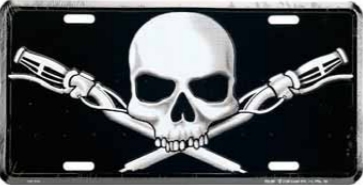
【スカルヘッドのライセンスプレート (クロスホーンハンドル)】 クロスホーンがバイクのハンドルになっているという。アメリカらしいアイデアの男らしいライセンスプレート/980円 (Candy Tower ☎06-6698-6969 www.candytower.com)