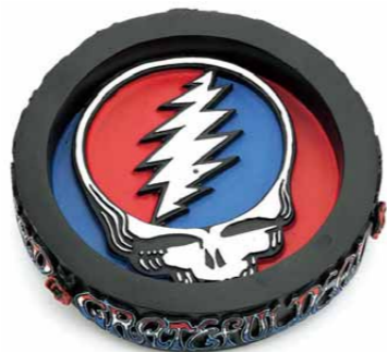
【Greatful Dead/Collectible Incense Burner】 中心の穴にインセンス(お香)を立てて使用。灰皿としても使える。裏側に穴が空いており、壁にもかけられるようになっている。直径4センチ/3780円 (TRIAD ☎045-431-9618 http://triadnet.hp.infoseek.co.jp)