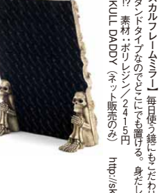
【スカルフレームミラー】 黒い木目調の鏡面を、またたくまにキラキラと輝かせる。素材：ポリレジン/4000円 (by 1. new territory (SKULL DADDY (ネット販売のみ) http://skulldaddy.jp))