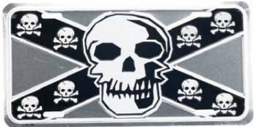
【スカルヘッドのライセンスプレート】 南軍旗のデザインをモチーフに、星の部分を全部スカルにしたデザイン。本体のキラリと光るメタルな風合いもポイント。愛車や部屋に/980円 (Candy Tower ☎06-6698-6969 www.candytower.com)