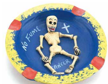
【MEXICO SKULL/メキシコ灰皿】 スペイン語で「タバコを吸うとガンになるよ」と書かれている。ユーモアのあるブラックジョークのいた灰皿。陶器製/1890円 (リビングストーン那須店 ☎0287-63-8025 www.livingstones.jp)