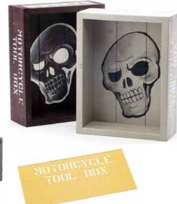
【スカルジュエリーハンガー】A4がA5大きめのオリジナルウッドボックス。好きなアクセサリーをディスプレイし、他カラー・デザインあり/4000円 (by 1. new territory (SKULL DADDY (ネット販売のみ) http://skulldaddy.jp))