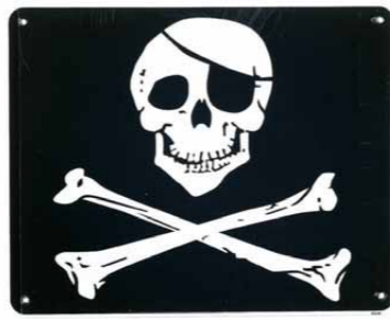
【アメリカンブリキ看板 (海賊マーク)】 あの海賊印がブリキ看板になって登場。アメリカ製。サイズ(約)：H18×W25.5センチ/1800円 (Candy Tower ☎06-6698-6969 www.candytower.com)