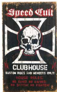
【スピードカルトクラブハウスの木製看板】 スピードにのり憑かれたマッドなヤツらが集まるクラブハウスをテーマにした木製看板。サイズ(約)：H45×W28.5センチ/6000円 (Candy Tower ☎06-6698-6969 www.candytower.com)