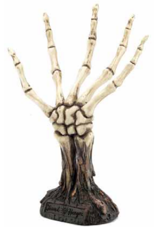
【スカルジュエリーハンガー】(一) 個個異なるリングをそのまま照らしてキラキラと輝かせる。SHOP 風アレンジインテリアを演出。by 1. new territory (SKULL DADDY (ネット販売のみ) http://skulldaddy.jp)