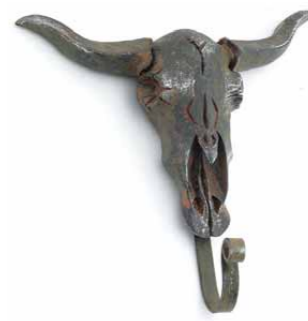
【カウスケルのウォールフック】 鉄の塊で作られたような見た目だが、実はレジン製。錆びた感じなど塗装でリアルに再現。サイズ(約)：H14×W16×D4センチ/1000円 (Candy Tower ☎06-6698-6969 www.candytower.com)