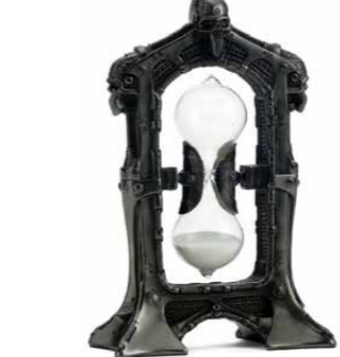
【メタリックスカルアウーグラス】 サンドタイマー(砂時計) 独特のゆったりとした時間を演出してくれる。サイズ：H21×W13×D6センチ 素材：ポリレジン/3675円 (SKULL DADDY (ネット販売のみ) http://skulldaddy.jp)