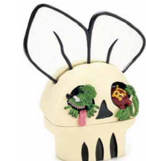
【RAT FINK Skull Flyジュエリーボックス】 レジン製のスカルフライジュエリーボックス。置物や小物入れにも最適。H13.3×W10.8×D5.2センチ/2940円 (MOONEYES ☎045-623-5999 www.mooneyes.co.jp)