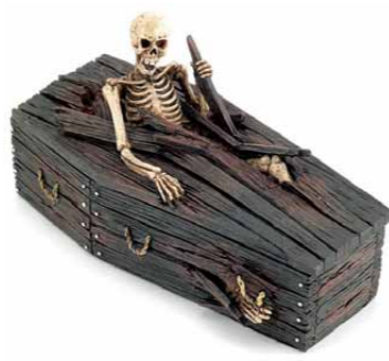
【スカル コフィンケース】 彩色、細部の作りなど申し分ない仕上りのレジン製小物入れ。特に棺の外壁の張り出しがかなりリアル! サイズ(約)：H8.5×W14×D7センチ/1570円 (大人の趣味空間 ☎048-687-3840 www.eorona.jp)