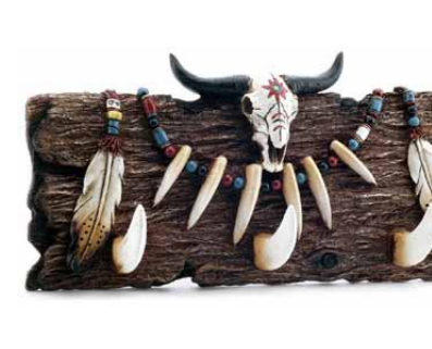
【バッファローズカルのハンガー】 レジン製。骨の形やひび割れ、木目など細かい部分まで再現できる形成力を活かした仕上がり。サイズ(約)：H15×W29×D6センチ/2980円 (Candy Tower ☎06-6698-6969 www.candytower.com)