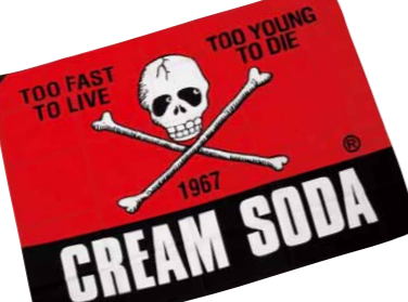
【CREAM SODA/角ドロフラッグ】 W約120センチ×H約90センチのオリジナルフラッグ/1575円 (PINK DRAGON ☎03-3498-2577 www.pinkdragon.co.jp)