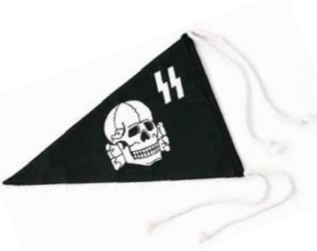
【HA SUPPORT FLAG】 ヘルズエンジェルズをサポートするペナント。USAからのインポート物/3990円 (FREE RIDE ☎0277-47-1055 www.free-ride.jp)