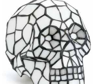
【Stand glass Skull light】 一点ずつ職人の手作りによるオリジナルのステンドグラス製スカルライト。光が床に反射し、簡単に部屋の雰囲気を出してくれる。ON/OFFスイッチ付/各1万8900円 (new territory ☎03-5784-2147 www.newterritory.net)