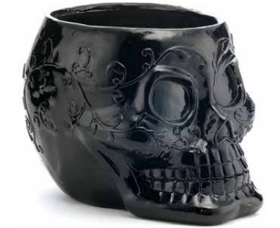
【CRIME/シュガースカルプランター (黒)】 メキシカンカルのプランター。植木を入れたり、小物入れにしたり、いろいろ利用できる。素材：FRP サイズ：H30×W28センチ/1万2600円 (Road ☎052-263-0050 www.road2009.com)