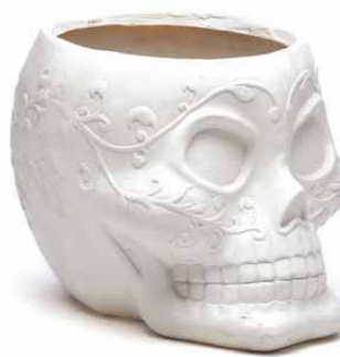
【シュガースカルプランター (白)】 FRP製プランターの白バージョン。各色“ツヤあり・ツヤなし”と全部で4種類ある。サイズ：H30×W28センチ/1万2600円 (CRIMIE ☎03-5775-5505 www.crimie.com)