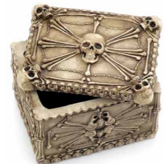
【スカルマルチケース】 乱雑になりがちなアクセサリーや、大切な小物を収納するマルチケース。蓋にマグネットが埋め込まれているので簡単にズレない。素材：ポリレジン/1890円 (SKULL DADDY (ネット販売のみ) http://skulldaddy.jp)