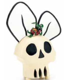
【RAT FINK ナイトライト】 ビッグサイズのSkull Flyの上で、ラトフィングがおどけたポーズをとっている。ON/OFFスイッチ付。H23×W18×D8センチ/7140円 (MOONEYES ☎045-623-5999 www.mooneyes.co.jp)